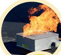
Générateur de flammes sans eau