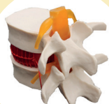
Simulateur de hernie