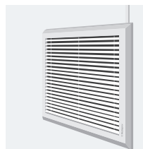
Extracteur de fumées permettant d'évacuer les gaz vers l'extérieur

Comme indiqué ci-dessus, les fumées représentent l'un des problèmes majeurs au cours d'une évacuation. Afin d'en réduire le volume, différents systèmes permettent leur extraction ou leur évacuation.