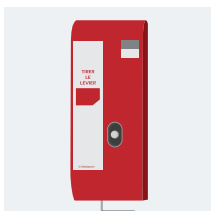
Boîtier de commande de désenfumage