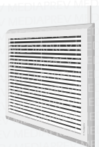
Extracteur de fumées permettant d'évacuer les gaz vers l'extérieur

Comme indiqué ci-dessus, les fumées représentent l'un des problèmes majeurs au cours d'une évacuation. Afin d'en réduire le volume, différents systèmes permettent leur extraction ou leur évacuation.